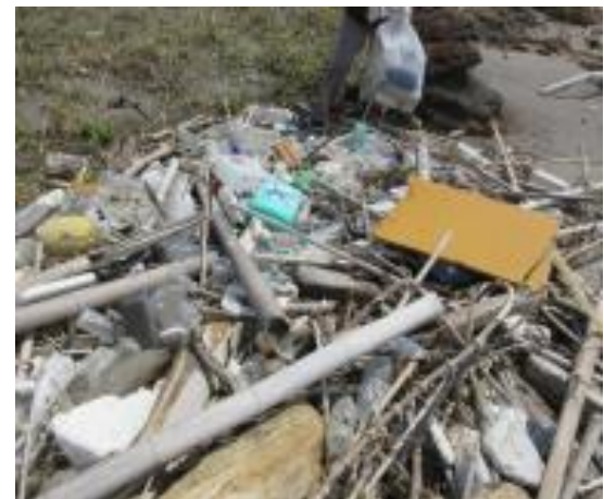
木材など一緒にペットボトルも多くある