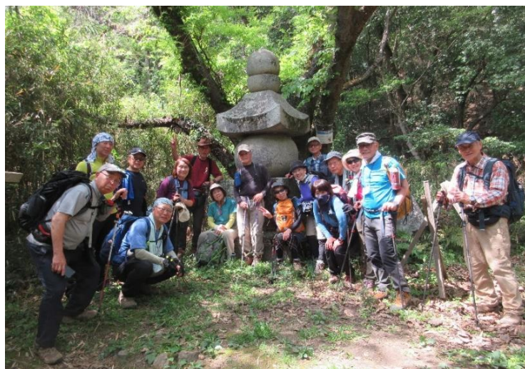
大きな石の五輪塔 もうすぐ生活道路に出ます