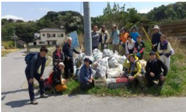
回収したゴミの前で

回収ゴミ量 143kg、(市ゴミ袋50袋+拾った大きな袋等) 多くがペットボトル