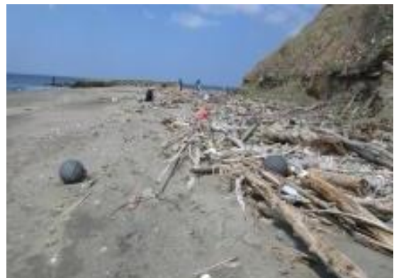
磯根海岸 この付近で実施