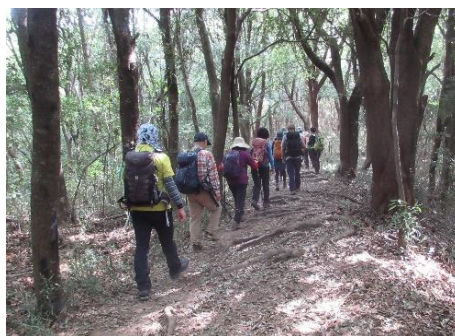
樹林帯の小田城コースを歩く

休憩所で整理体操を行い、名残惜しいが解散する。今回は晴天に恵まれ、十分に親睦を図ることができ参加者の方々が満足できた交流山行となりました。次回は松戸山の会に幹事を行ってもらおうことにしました。参加の皆様お疲れさまでした。