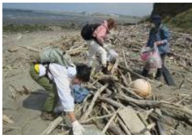
多くのゴミがあるね~