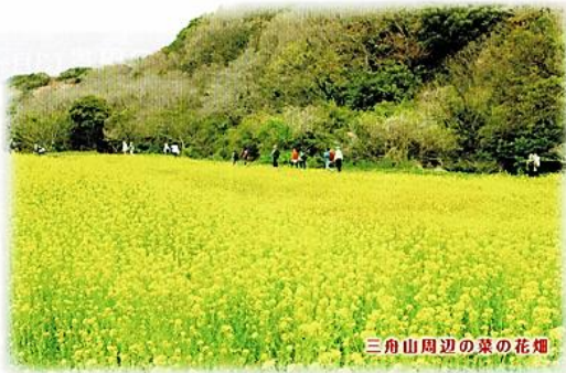
三舟山周辺の菜の花畑