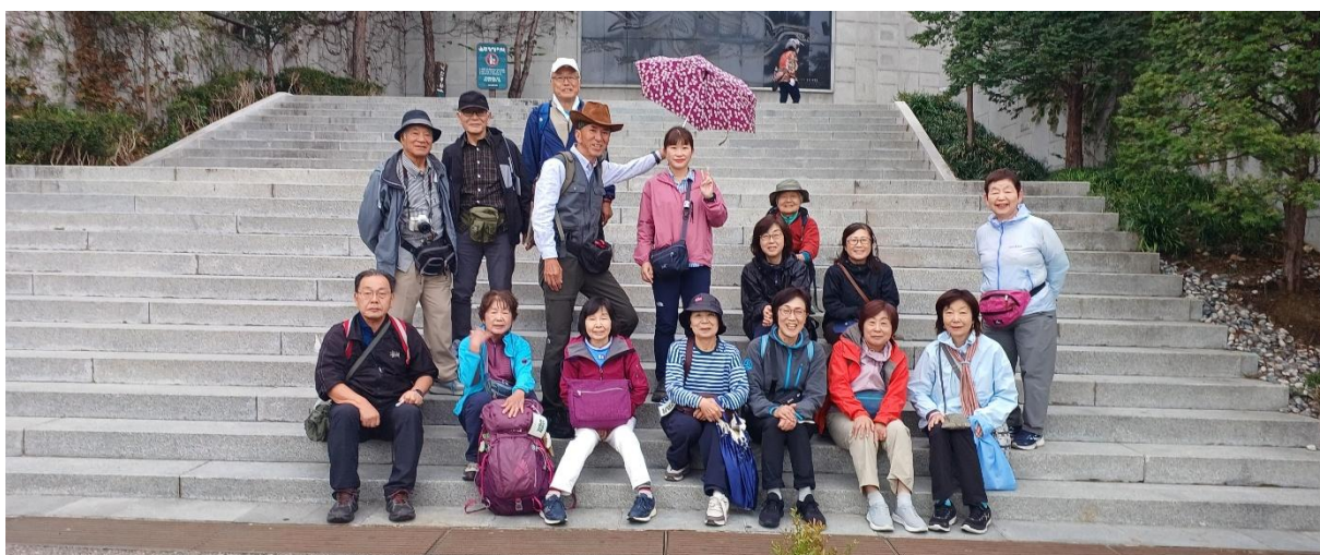
帰国日（10/21）午前の市内観光（Naksan Park：ナクサン公園）