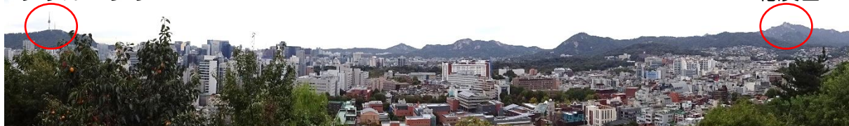
Naksan Park からの大展望（スイング・パノラマ撮影）