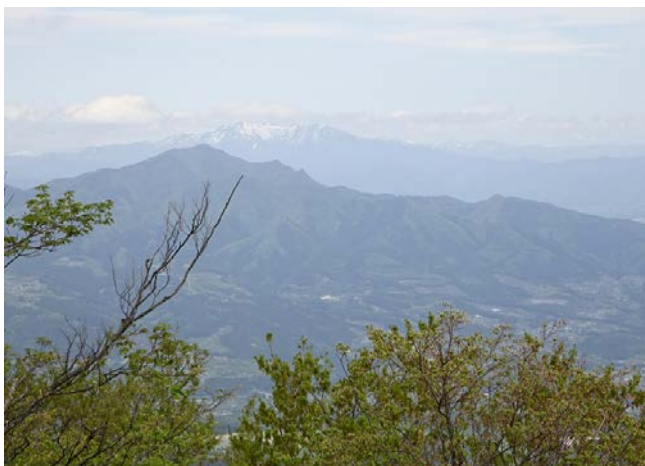
水沢山頂上より。奥が上州武尊山、手前が子持山