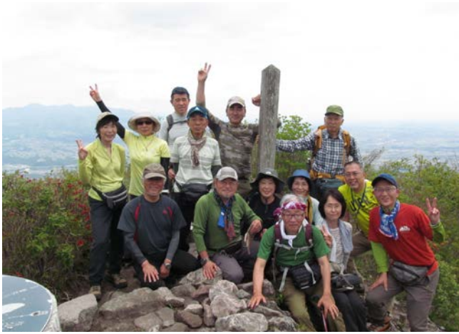
水沢山頂上にて全員集合