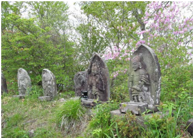
水沢山の尾根に登り詰めたところで石仏群のお出迎え