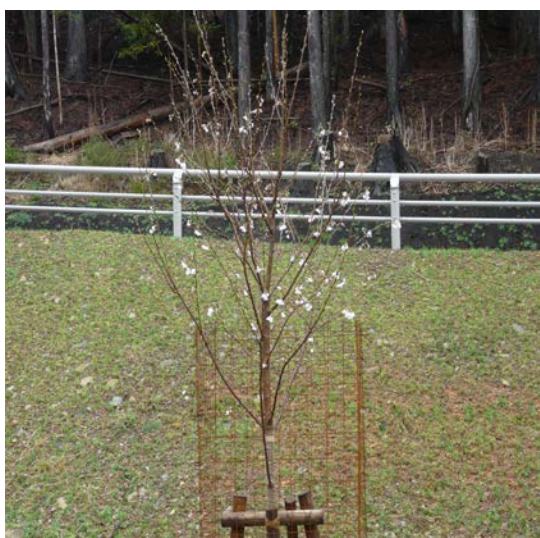
エドヒガンの開花（4月18日）

さて、先月号で定期総会の報告をしたところですが、今期は定期的な活動ではなく、必要に応じて活動していくことになりました。その際はちばニュース、メール等で発信したいと思います。よろしく願い致します。