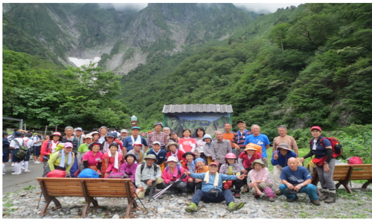
終焉の地・一の倉沢をバックに。 詳細は11ページに掲載